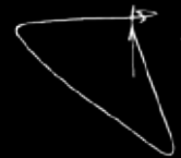
Serge Le Boulch